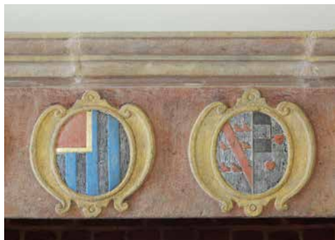
De wapens van de families Van Breyll en Van Eynatten boven de ingangspoort van het kasteel en op de schouw in de ridderzaal van het kasteel.