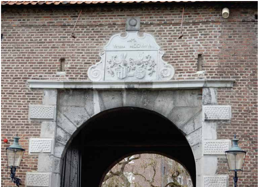
Detail van het poortgebouw na de reconstructie van de wapenstein.