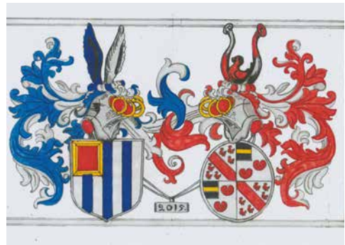
De ontwerptekeningen van René Vroomen.