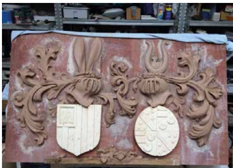
De wapenstein, vervaardigd in was, in het atelier van Armand Mathijs.

Na de zomervakantie kon Armand Mathijs aan de slag gaan, eerst in zijn atelier. Hier vervaardigde hij de afbeeldingen van de wapens, de helmen en helmtekens, de dekkleden en het chronogram in was. Hiervan werden mallen gemaakt, die weer gevuld werden met monulit. Deze moesten eerst uitharden. Intussen naderde snel de beoogde onthullingsdatum van 6