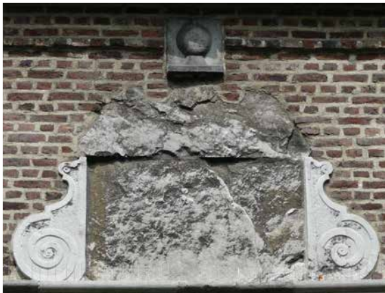
De situatie boven de poort van de voorburch, vóór en ná de reconstructie in 2015.

Toen het bestuur van de Stichting Kasteel Limbricht zich in 2014 afvroeg, hoe aandacht besteed zou kunnen worden aan het zestigjarig bestaan in 2015, kwam het idee op om de wapenstein te laten reconstrueren. Zolang gedacht werd dat de soldaten van Napoleon de oorzaak van het verdwijnen ervan waren, was dat niet gedaan, omdat de verweerde wapenstein herinnerde aan een periode uit de geschiedenis van het kasteel. Nu er een nieuwe verklaring was, die de reconstructie van de wapenstein niet 'belemmerde', werd in het najaar van 2014 besloten tot reconstructie.