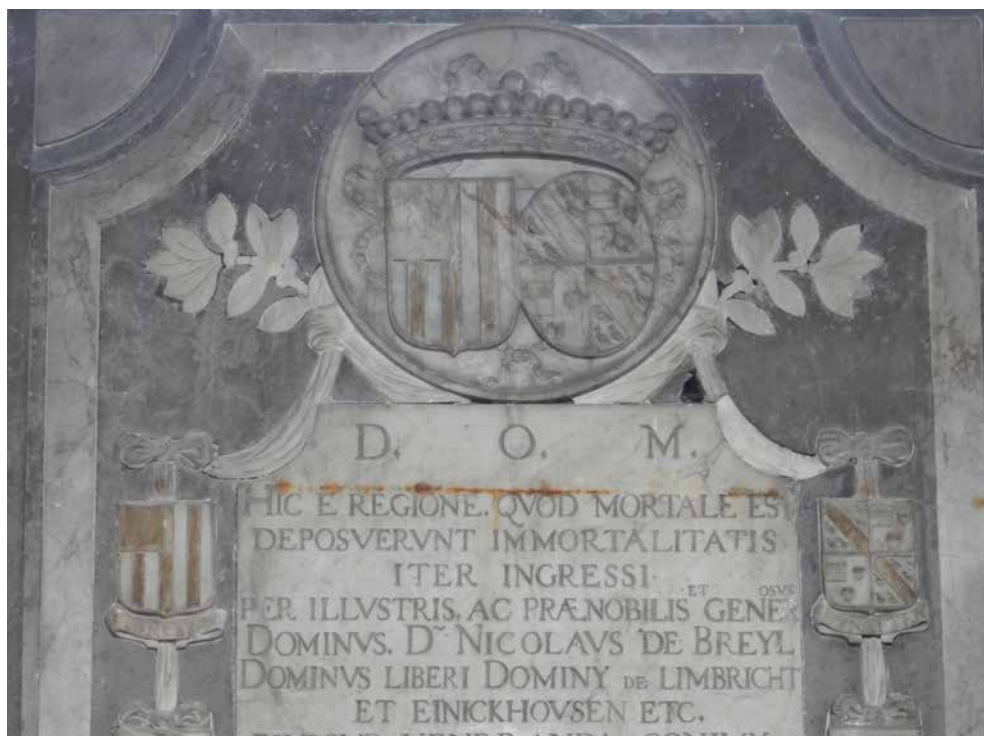
De wapens van de families Van Breyll en Van Eynatten op de memoriesteen in het Sint-Salviuskerkje.

De officiële beschrijving van het wapen luidt dan als volgt: 9)