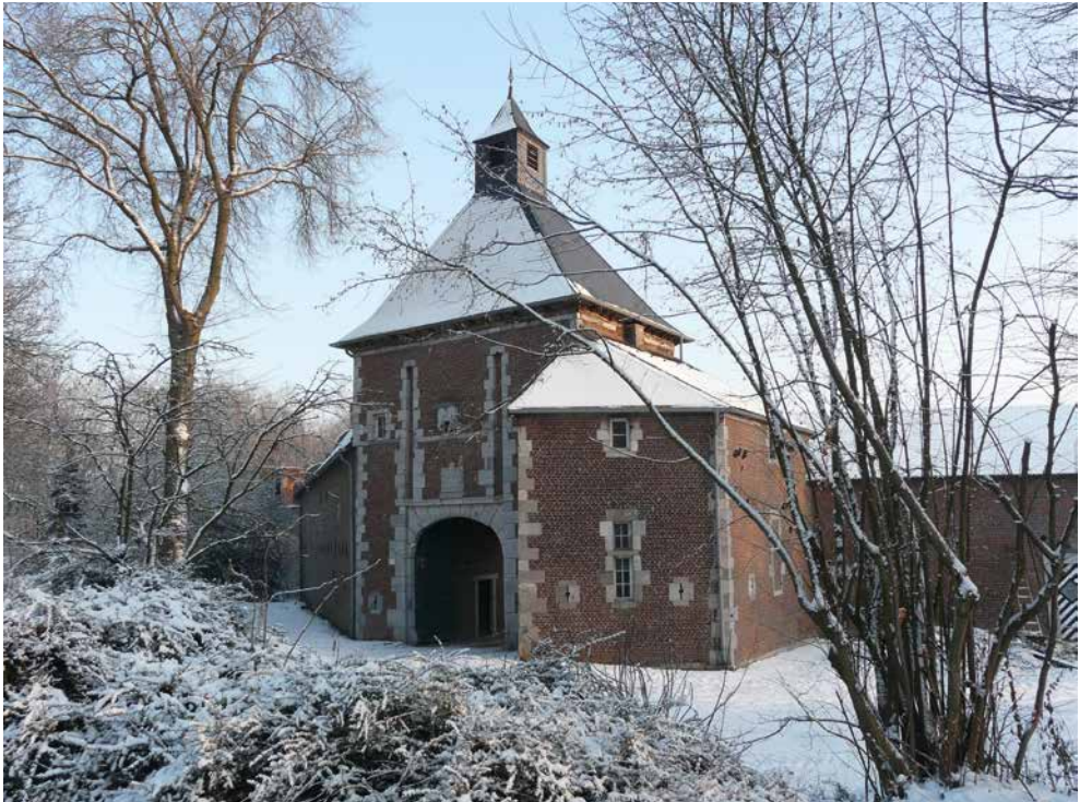
Poortgebouw van kasteel Leerodt bij Geilenkirchen, stamslot van de familie Von Leerodt.

In een serie beschrijvingen in komende uitgaven van het Historisch Jaarboek uit het Land van Zwentibold, willen we een aantal van deze nog bestaande families weer ‘tot leven wekken’, om daarmee het heden en verleden, én (daar waar van toepassing) de beide grensgebieden tot elkaar te brengen. Bedoeling van deze bijdragen is niet primair het aandragen van nieuw wetenschappelijk materiaal (deze families zijn veelal al uitvoerig bestudeerd en beschreven) maar om hun voortbestaan tot in de huidige tijd te illustreren.