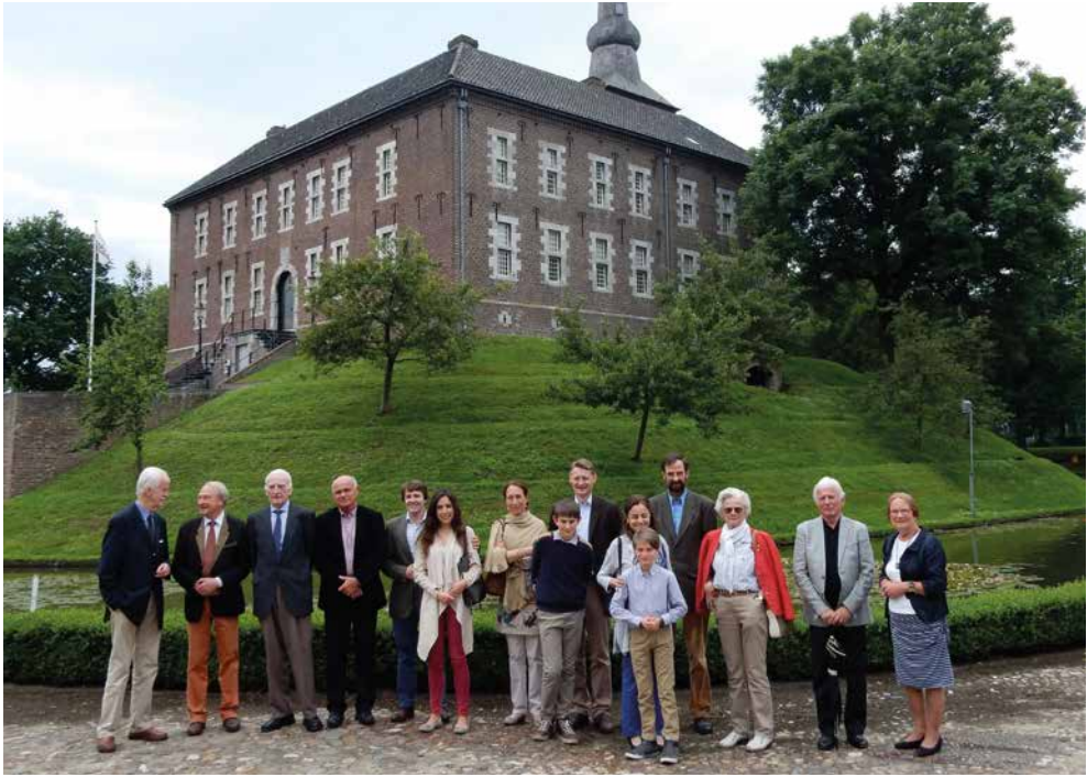
De gasten voor kasteel Limbricht op 12 juni 2016.