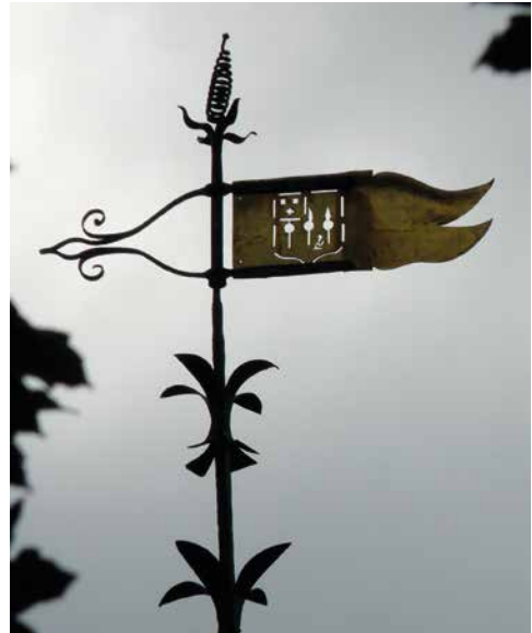
Windvaan op het poortgebouw van kasteel Wolfrath met daarin het wapen van de familie Jhr. Kerens de Wolfrath.

5. Steeds meer ‘gewone’ mensen kunnen aantonen dat ze afstammen van Karel de Grote. Dat is niet zo verwonderlijk: aangezien iedereen twee ouders heeft, vier grootouders en acht overgrootouders, en er zich tussen Karel de Grote en de tegenwoordige tijd gemiddeld veertig generaties bevinden, zouden we rond het jaar 800 in theorie 1.099.511.627.776 ( 2^{40} ) voorouders moeten hebben. Er leefden in die tijd in West-Europa slechts maximaal 40.000.000 mensen. Het verschil tussen het theoretisch veel hogere aantal voorouders en wat in de praktijk maximaal mogelijk is, komt doordat een voorvader of -moeder meermaals in een kwartierstaat kan voorkomen (‘voorouderverlies’ of ‘kwartierherhaling’). We kunnen dus, bij wijze van spreke, allemaal van Karel de Grote afstammen, maar die afstamming genealogisch aantonen is een andere zaak. We zijn waarschijnlijk wel allemaal genetisch verwant aan elkaar, dus ook aan vele adellijke families. 7) In ieder geval zijn de meeste adellijke families in de regio aantoonbaar verwant aan elkaar.